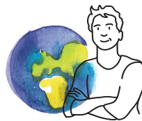
Sociální a ekologický dopad