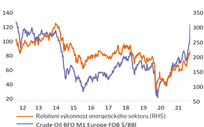
Vývoj cen ropy Brent a energetického sektoru