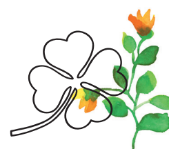
Společensky odpovědné investování