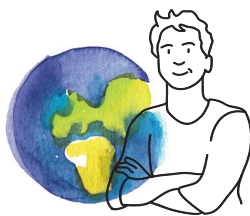
Sociální a ekologický dopad